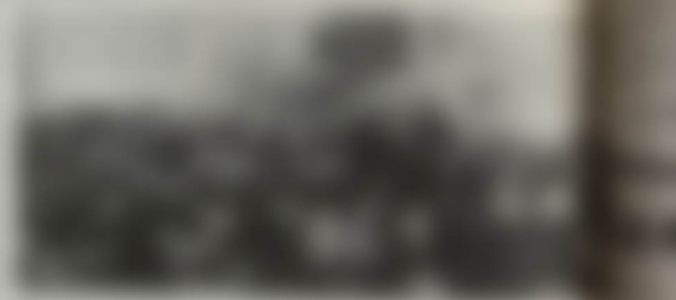
Соплеменники в тундрах и палатках

Азербайджан не мог не принять соплеменников, но за прошедший с тех пор год для них было очень мало практически сделано. Многие и сегодня живут в тундрах и палатках, не имеют работы, не имеют даже прописки, а среди их детей свирепствуют эпидемии.